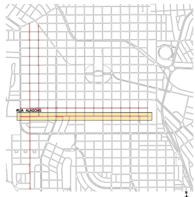
PLANTA DE LOCALIZAÇÃO ESCALA 1:15000