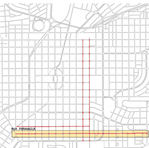
PLANTA DE LOCALIZAÇÃO ESCALA 1:15000