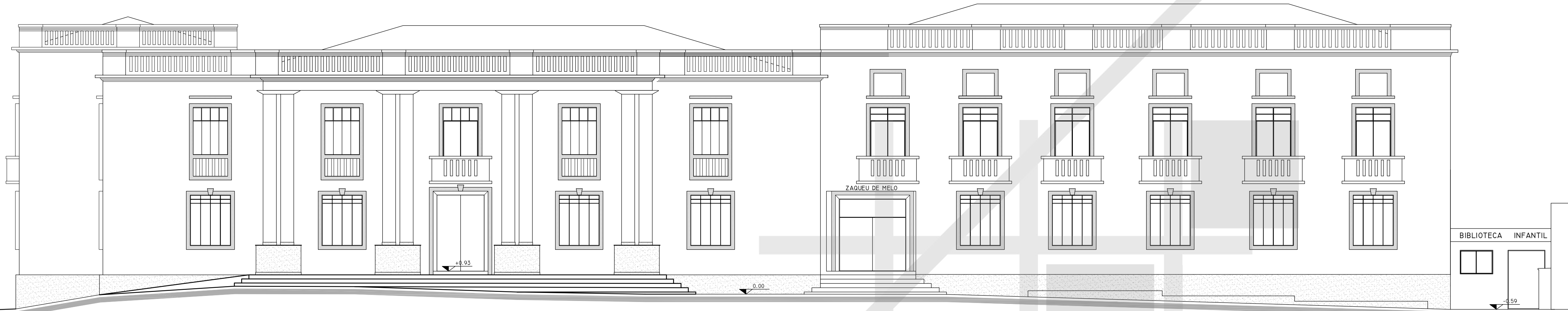
8 LEVANTAMENTO ELEVAÇÃO 01 : AV. RIO DE JANEIRO ESCALA 1:100