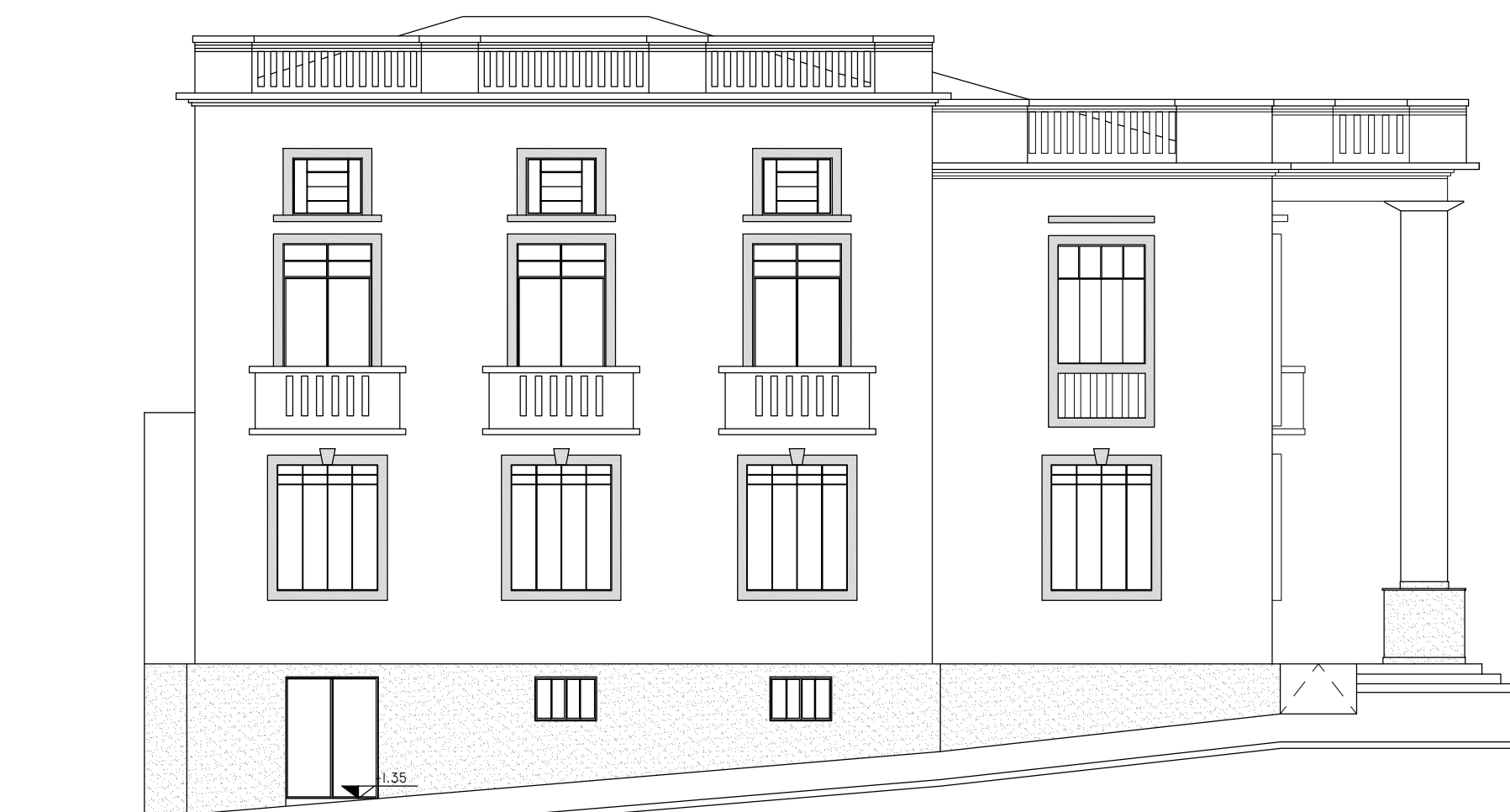
9 LEVANTAMENTO ELEVAÇÃO 02 : ALAMEDA MANOEL RIBAS ESCALA 1:100